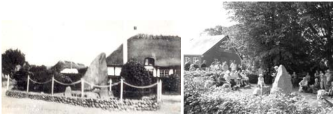
Mindestenen før 1942