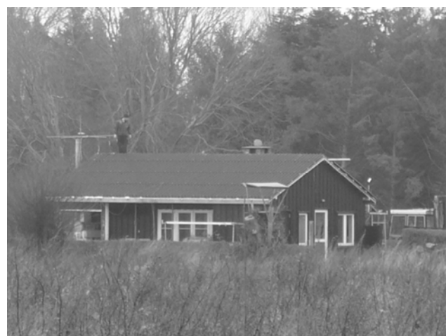
Øhavets tømrer har altid travlt – oppe, nede, ude som inde. Her får "Hønsehuset" nyt tag.

Vores morgenbuffet åbner kl. 7.00, så Du har mulighed for en kop morgenkaffe på Hotel Ærø, når Højestene ankommer 7.30.