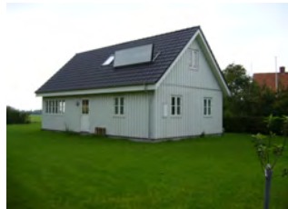
Gonges hus bygget 2007